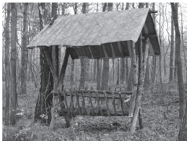
Paśnik dla zwierząt w katowickim „Parku Leśnym”.

Bardzo istotnym problemem, który również ma wpływ na częstsze wizyty gości z lasu na osiedlu, jest ich bezmyślne dokarmianie – chodzi głównie o dziki. Zarówno zimą, jak i latem trafiają się zwolennicy dokarmiania dzików myśląc, że tego potrzebują. Tymczasem jest odwrotnie! Dokarmiając, oswajamy je i pokazujemy im, że nasze otoczenie jest przyjazne, bezpieczne i ułatwia zdobycie pożywienia. Konsekwencją dokarmiania jest to, że podchodzą do granic osiedla, buchtują, niszczą trawniki i stwarzają tym samym niebezpieczeństwo. Samice dzików – lochy mając blisko źródło pokarmu mogą zadomowić się w okolicznych zaroślach, aby urodzić w „przyjaznym” otoczeniu, a w obronie swojego potomstwa stają się wyjątkowo waleczne. Dziki to nie tylko zagrożenie dla człowieka. Psy przy starciu z dzikiem są na przegranej pozycji. Udokumentowano przypadki, gdzie sprowokowany dzik zabił nawet niedźwiedzia. To świadczy o sile i determinacji tego zwierzęcia w sytuacji zagrożenia. Również w zimie, która dla wszystkich zwierząt jest trudnym okresem, nie powinno się ich dokarmiać, szczególnie w obrębie osiedla. Jest to zadanie leśników i członków Związku Łowieckiego, którzy robią to w odpowiednio przystosowanych miejscach z zachowaniem odpowiedniej diety (fot. 2). Natomiast jak najbardziej można wspomóc wszelkiego rodzaju akcje np.: zbierania żołądki na zimowe dokarmianie.