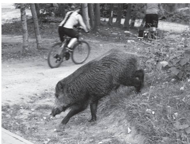
Dzik w rejonie wodnego placu zabaw.

Katowice są pod względem zalesienia czwartym miastem na prawach powiatu w Polsce. Nasze osiedle powstało w bezpośrednim sąsiedztwie jednego z większych kompleksów leśnych – Lasów Murckowskich. Z ich części, graniczącej bezpośrednio z miastem, wydzielono Katowicki „Park Leśny”, który wraz z Doliną Trzech Stawów stanowi podmiejską strefę rekreacyjną, chętnie odwiedzaną przez mieszkańców osiedla. Jest to doskonałe miejsce do wypoczynku oraz obcowania z przyrodą. Na pobliskich stawach można spotkać łabędzie, kaczki, łyśki, czasem gniazdują perkozy. W lesie można zobaczyć sarny, dziki, lisy oraz pospolitsze zające i jeże. Niestety, negatywny wpływ człowieka na środowisko, rozwój miasta, które małymi krokami wkracza na te tereny leśne, powoduje coraz częstsze spotkania z dziką fauną. Spotkania te nierzadko zdarzają się na terenie naszego osiedla, a zające i jeże są już właściwie jego mieszkańcami.