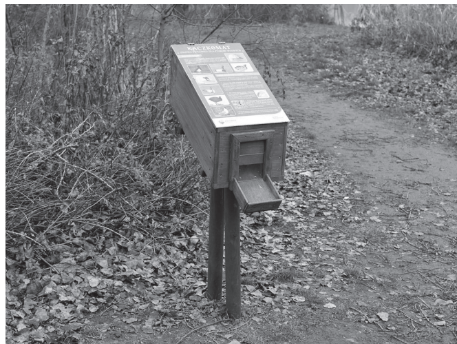
Dozownik z pokarmem dla ptactwa wodnego.

Bliskość stawów generuje z kolei problem z dokarmianiem ptactwa wodnego. Szczególnie przy zejściu prowadzącym nad staw „Łąka” jest to bardzo widoczne. Ogromne ilości niewykorzystanego w domu pieczywa trafiają nad brzeg stawu, gdzie raczą się nim kaczki, łabędzie i oczywiście gołębie, a nadmiar pokarmu staje się pożywką dla szczurów. Pomijając zanieczyszczanie wody, największym problemem jest fakt, że chleb różni się znacznie od pokarmów występujących w środowisku, a po za tym organizmy ptaków nie są fizjologicznie przystoso-