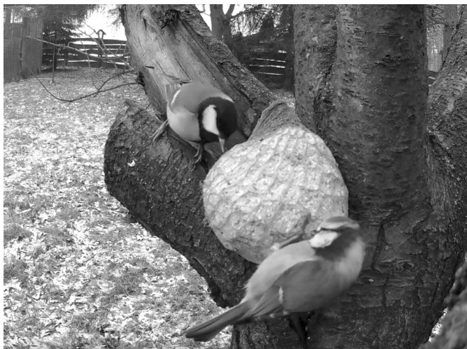
Kulki tłuszczowe z ziarnem dla ptaków.

Bliskość stawów generuje z kolei problem z dokarmianiem ptactwa wodnego. Szczególnie przy zejściu prowadzącym nad staw „Łąka” jest to bardzo widoczne. Ogromne ilości niewykorzystanego w domu pieczywa trafiają nad brzeg stawu, gdzie raczą się nim kaczki, łabędzie i oczywiście gołębie, a nadmiar pokarmu staje się pożywką dla szczurów. Pomijając zanieczyszczanie wody, największym problemem jest fakt, że chleb różni się znacznie od pokarmów występujących w środowisku, a po za tym organizmy ptaków nie są fizjologicznie przystoso-