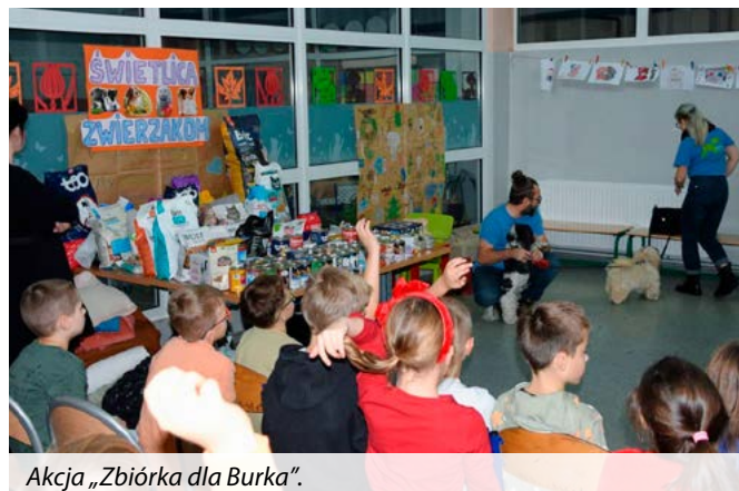
Akcja „Zbiórka dla Burka”.

Serdecznie dziękujemy w imieniu pracowników schroniska oraz ich podopiecznych za wszystkie przekazane dary.